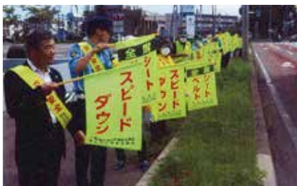
▲帯広／関係機関・団体と連携し、帯広署前の国道38号沿いで旗の波啓発を実施