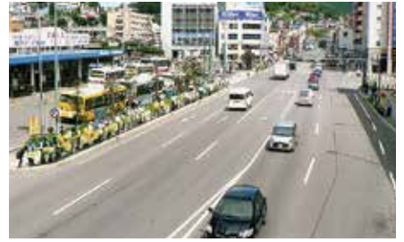
▲小樽／関係機関・団体と連携し、小樽駅前 の国道5号沿いで安全運転を呼びかけ