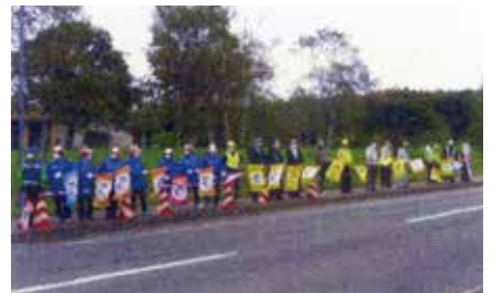
▲弟子屈／国道243号沿いで旗の波啓発を実施するとともに啓発グッズを配布