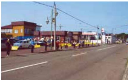
▲羽幌／国道232号沿いで交通安全旗を掲げ、スピードダウンの実践などを呼びかけ