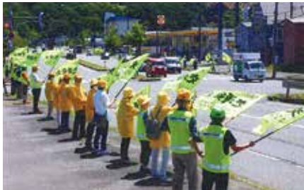
▲室蘭／国道37号沿いで関係者90人が交通安全旗を掲げて事故防止をアピール