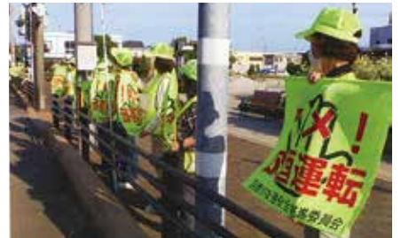
▲函館中央／函館競馬場前の沿道で近隣町会の会員とともに安全運転を呼びかけ