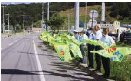
▲留萌／全道一斉旗の波運動として「道の駅」前の国道231号沿いで事故防止を訴え