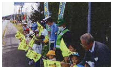
▲興部／秋の運動の出動式後、保育所の幼児が国道238号沿いで安全運転を呼びかけ