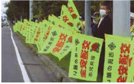
▲岩見沢／秋の運動初日、「市民の集い」終了後に国道12号沿いで旗の波啓発を実施