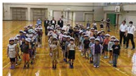
▲ヘルメットを着用した米里小学校の児童