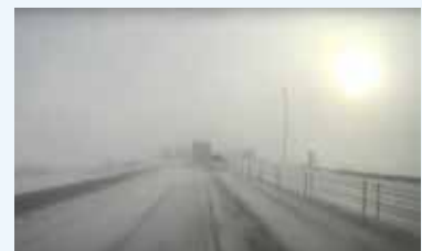
▲下記動画④の1シーン

個人で視聴するほか、職場・地域での安全教育に利用するなどして、安全運転・安全通行の実践、交通事故の防止にお役立てください。