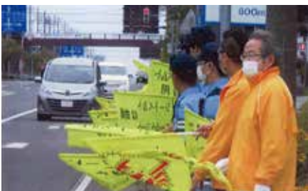
▲根室／秋の運動初日、根室振興局前の交差点でシートベルト着用などを呼びかけ