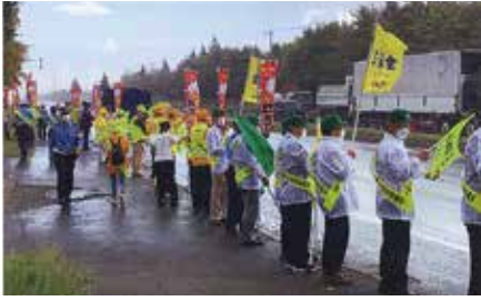
▲札幌手稲／手稲区・石狩市・小樽市合同の街頭啓発を国道337号沿いで実施

地区の活動は会員の皆さんの会費や賛助金などで 行っています。ご協力をお願いします。