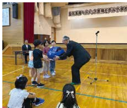
▲米里小学校で開かれた「モデル小学校指定式・ヘルメット寄贈式」

● 令和5年度のモデル小学校…米里小学校(白石区)、元町小学校(東区)、資生館小学校(中央区)、藤野小学校(南区)