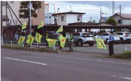
▲伊達／夏の運動期間中、管内の幹線道路沿いの9カ所でパトライト作戦を展開