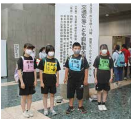
◀滝上小学校チームの選手たち

その結果、静岡県浜松市立平山小学校チームが団体優勝し、滝上小学校チームは32位となり、北海道代表として過去最高の成績を収めました。