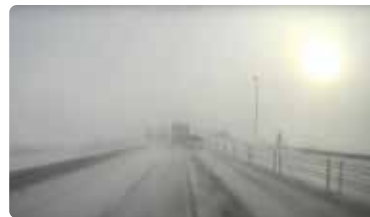
↑「冬道」動画の1シーン