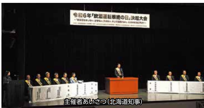
主催者あいさつ(北海道知事)

さらに、「北海道から飲酒運転を根絶！学生PR動画コンテスト」の入賞作品が上映されたあと、(株)エフエム北海道、キリンビール(株)、全国共済農業協同組合連合会北海道本部による飲酒運転根絶に向けた取組事例が紹介され、最後に「飲酒運転根絶道民宣言」が行われて閉会しました。