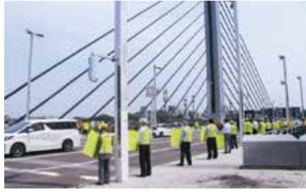
▲札幌南／ミュンヘン大橋を通行する車両のドライバーに安全運転をアピール