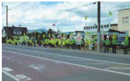
▲名寄／国道239号沿線市町村一斉啓発として、交通安全監視所前で事故防止を訴え