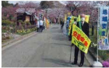
▲松前／「松前さくらまつり」の来場者に交通安全・防犯の啓発グッズを配布