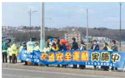
▲網走／「道の駅」前の道道沿いで横断幕や交通安全旗を掲げ、事故防止をアピール