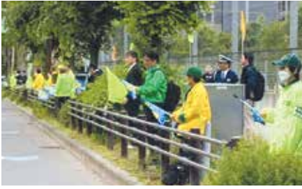
▲札幌中央／高齢歩行者の死亡事故が発生した現場付近の沿道で旗の波啓発を実施

地区の活動は会員の皆さんの会費や賛助金などで 行っています。ご協力をお願いします。