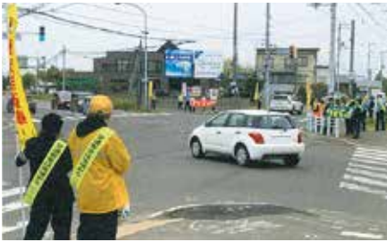
▲札幌手稲／大型スーパー前の交差点で通勤・通学中の自転車利用者への啓発を実施