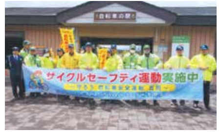
▲札幌厚別／サイクリングロードの利用者にヘルメット着用など安全利用を呼びかけ