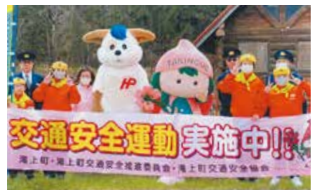
▲紋別／滝上町の「道の駅」利用者に交通安全少年団の団員が安全運転を呼びかけ