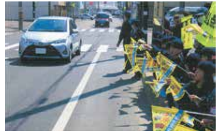
▲江差／幹線道路沿いで江差幼稚園の園児が三角旗を掲げて安全運転を呼びかけ