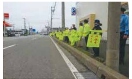
▲稚内／「無事故の日」(6月25日)に国道40号沿いで安全運転を呼びかけ