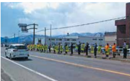
▲新得／春の運動の一環として、新得警察署前の国道38号沿いで旗波作戦を実施