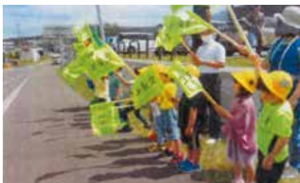
▲稚内／利尻町の保育所の子どもが沿道から町民や観光客に交通事故防止をお願い