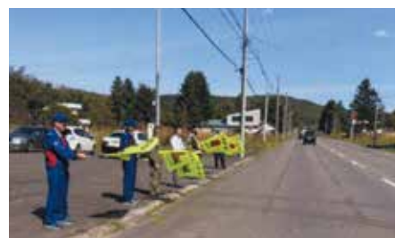
▲興部／興部町の国道239号の死亡事故発生場所付近で安全運転を呼びかけ