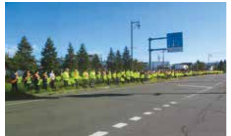
▲栗山／秋の運動の活動として、長沼郵便局前の道道沿いで旗の波啓発を実施