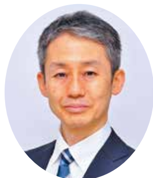
北海道警察本部長