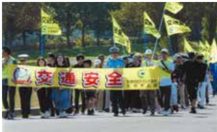
▲札幌東／トラック協会札幌東支部が「さとらんど」内で交通安全パレードを実施

地区の活動は会員の皆さんの会費や賛助金などで 行っています。ご協力をお願いします。