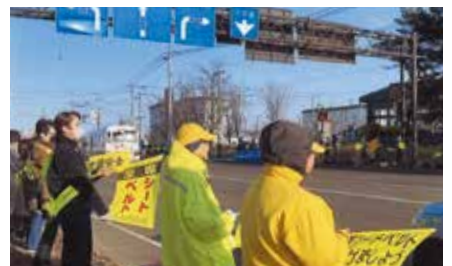
▲根室／根室振興局前の国道44号交差点周辺で「セーフティコール」を実施