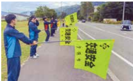
▲夕張／北海道夕張高校の交通安全委員の生徒が国道452号沿いで早朝啓発を実施