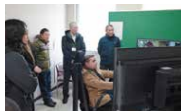
▲ドライビングシミュレーター体験