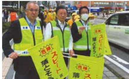
▲札幌白石／決起大会終了後、複合庁舎前の沿道で200人が安全運転をアピール