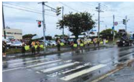
▲森／関係機関・団体と連携し、森町の国道5号沿いで飲酒運転根絶などを呼びかけ