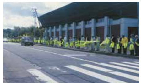
▲寿都／寿都町の国道229号沿いで129人参加の「旗の波100人作戦」を展開