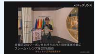
▲下記動画①(北海道ワイドエリア編)の1シーン