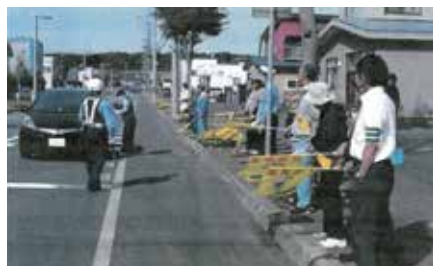
▲羽幌／初山別駐在所前で国道232号の通行車両にスピードダウンなどを呼びかけ