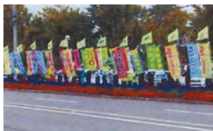
▲北見／秋の運動の一環として、北見市の国道39号沿いで旗の波啓発を実施