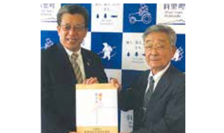
▲斜里／新年度を前に、新1年生向けの交通安全啓発用教材セットを斜里町に贈呈