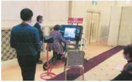
▲札幌北／高齢者を対象に自転車シミュレーターや飲酒ゴーグルなどの体験会を実施

地区の活動は会員の皆さんの会費や賛助金などで 行っています。ご協力をお願いします。