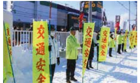
▲旭川東／酒造会社の酒蔵開放イベントに合わせ、飲酒運転根絶の啓発活動を実施