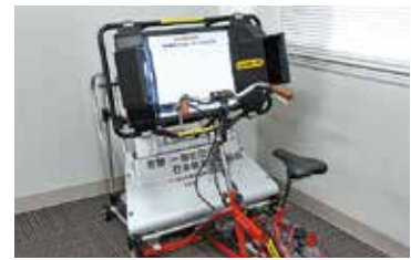
▲寄贈された自転車シミュレーター