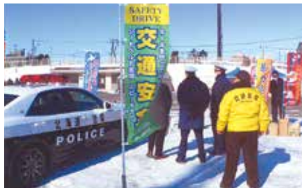
▲釧路／釧路港で行われた「くしろ冬まつり」の来場者に冬型事故防止を呼びかけ