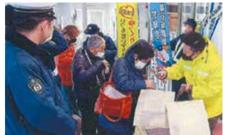
▲根室／市立根室病院前で、受診に訪れた高齢者や家族に啓発チラシなどを配布