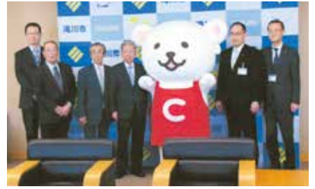
▲滝川／新入学児童向けの交通ルールブックやランドセルカバーなどを滝川市に贈呈