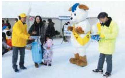
▲旭川中央／「旭川冬まつり」の会場で反射材の活用や飲酒運転根絶などを呼びかけ