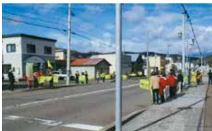
▲遠軽／生田原駐在所前の国道242号沿いで地域住民ら40人が旗の波啓発を実施