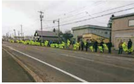
▲栗山／南幌町の幹線道路沿いで70人が交通安全旗を掲げて事故防止をアピール