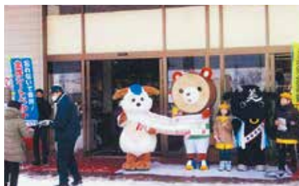
▲美幌／美幌交通少年団の団員が大型スーパー前で交通安全・防犯を呼びかけ