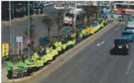
▲小樽／小樽駅前の国道5号沿いで春の運動の「セーフティコール」を実施