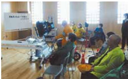
▲名寄／交通安全団体の関係者を対象にした「自転車シミュレーター体験会」を実施